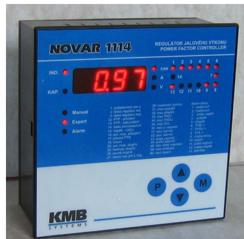
Obr. 1 : Novar-1114

Aby regulátor vykompenzoval i minimální zatížení, musí mít připojeny kondenzátory potřebné malých hodnot. Při velkém provozním zatížení pak regulační odchylka dosahuje běžně